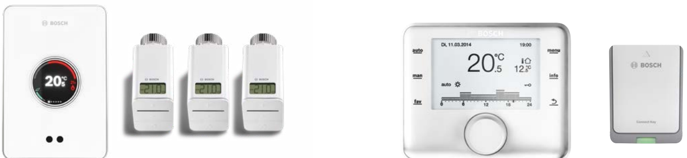
Розумний регулятор EasyControl з керованими радіаторними термостатами

Крім того, конденсаційним котлом Condens 2300i W можна дистанційно керувати за допомогою додатка HomeCom Easy, через модуль Connect Key (доступний як аксесуар) і за допомогою додатка EasyControl у поєднанні з розумним регулятором EasyControl CT200.