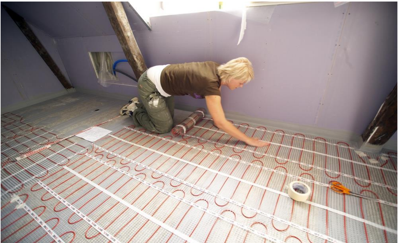
Рис. 3. Монтаж нагревательного мата DEVIheat™ 150S (DSVF-150) на основание из плит ГВЛ под плитку.

При выборе нагревательных матов необходимо учитывать допустимый разброс параметров, приведенных в технических характеристиках, и возможные отклонения напряжения питающей сети.