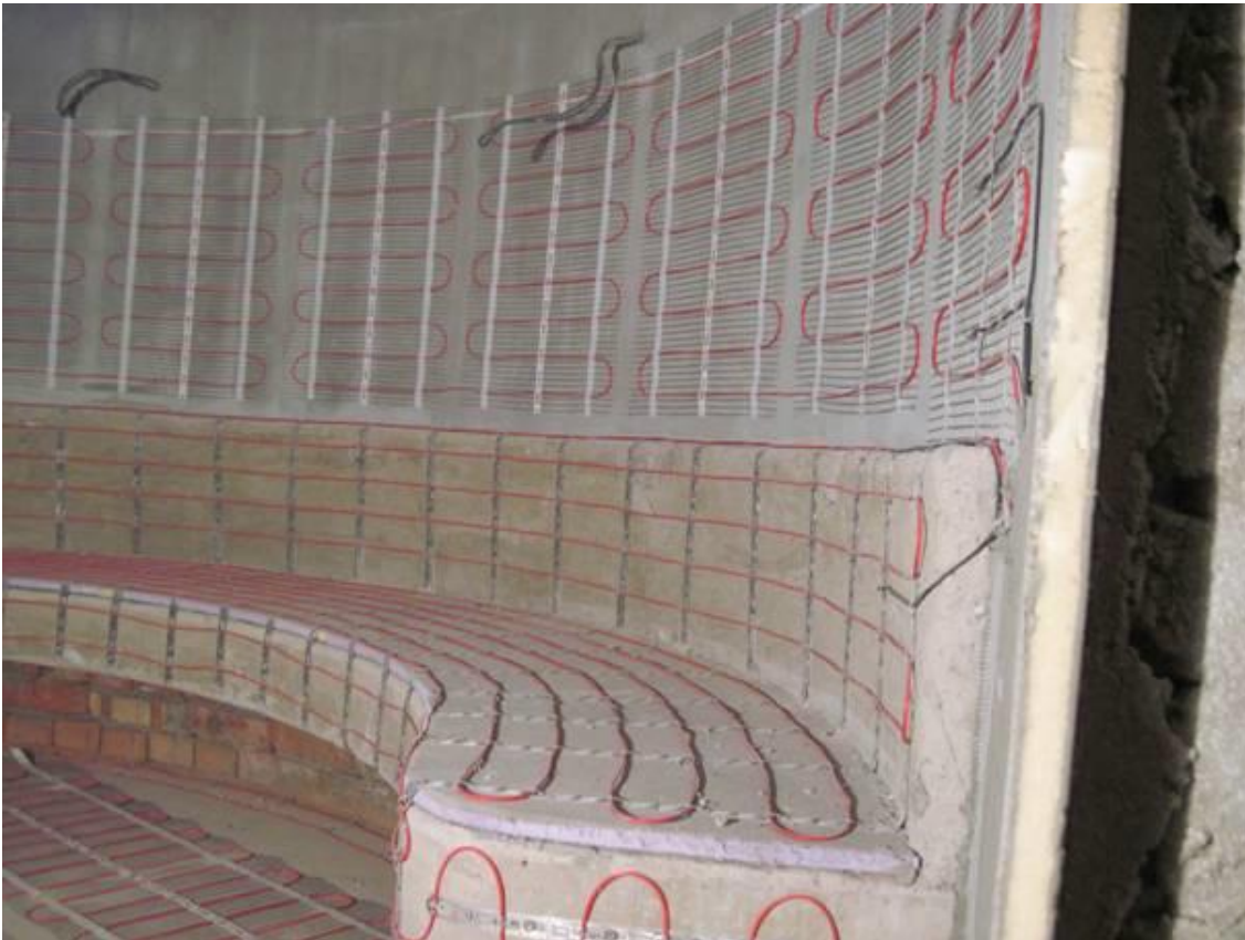
Рис. 4. Монтаж нагревательного мата DEVIheat™ 150S (DSVF-150) на стене в турецкой бане.