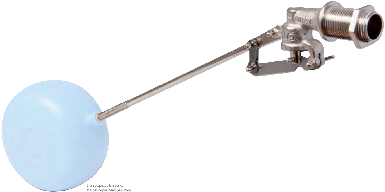
Sfera acquistabile a parte. Ball can be purchased separately.

5 split pins float valve in pressed brass.