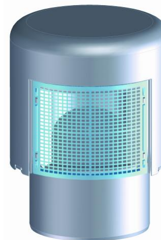
Воздушный клапан HL900N(NECO)

Производитель оставляет за собой право без предварительного уведомления покупателя вносить изменения в конструкцию, комплектацию или технологию изготовления изделия с целью улучшения его свойств.