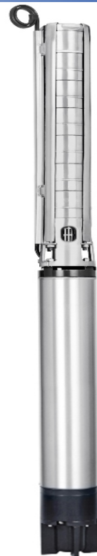
Розміри та вага: